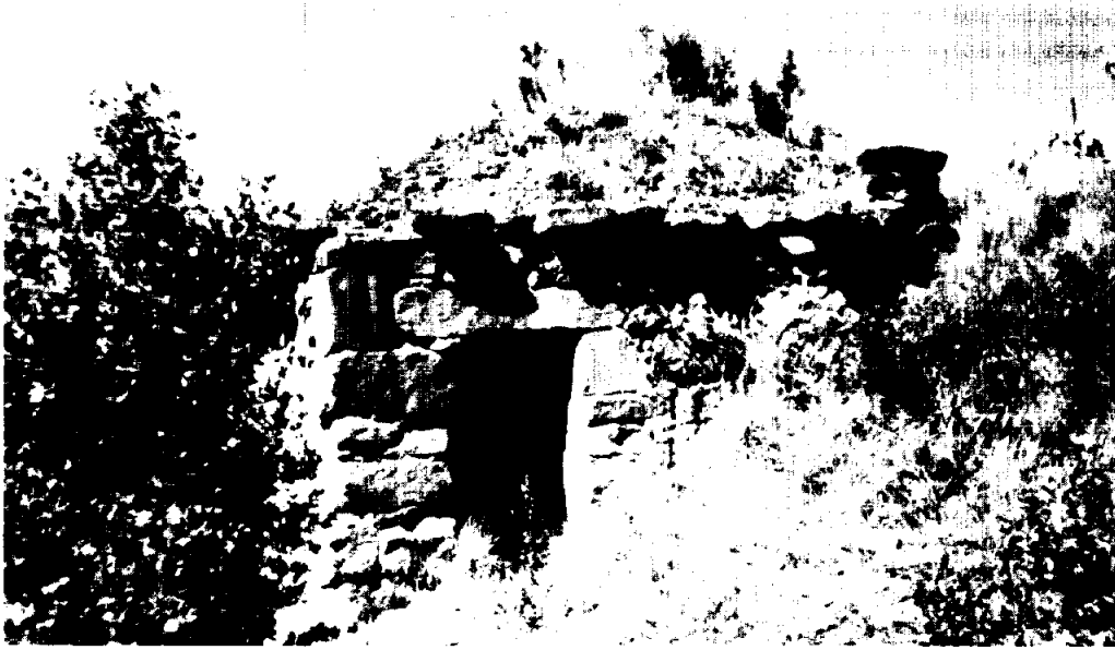
BARRACA DEL BLASI. Viladoms. Constava de dues barraques com molts dels llocs de conreu. Feta de pedra i fang. La primera està actualment sencera.