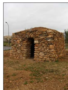
La feina feta