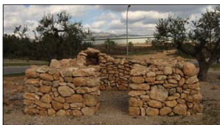
A mitja paret