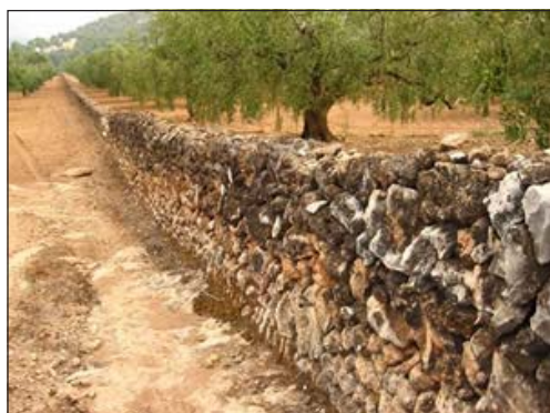
Llarg marge que separa finques i pou de pedra seca

Diputació de Tarragona. Properament, podrem veure una part d'aquesta completíssima exposició a Sant Martí. Ha estat arran d'aquest intercanvi cultural de les revistes, que El Martinet s'ha posat de nou en contacte amb un altre dels membres d'aquesta entitat i on ha descobert part de l'equip humà que hi ha al darrere d'aquesta Secció mediambiental que està molt sensibilitzada amb tota la problemàtica mediambiental i del món rural en especial. Tal i com