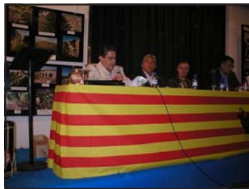
Presentació de la IV Trobada

Des de la revista Pedra Seca animem les entitats culturals i col·lectius de les terres de parla catalana, a donar continuïtat, i per tant prestigi, a aquestes Trobades de preservació del nostre patrimoni de pedra en sec.