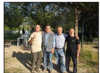
Els membres del Drac