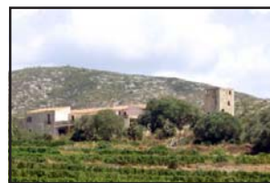
Esmorzar a Can Planes Sitges - Massís del Garraf - Garraf