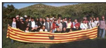
Excursió pel Parc Natural del Garraf