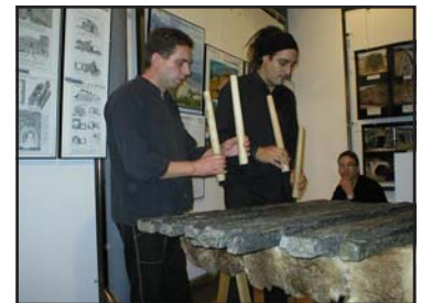
Recital de txalaparta de pedra