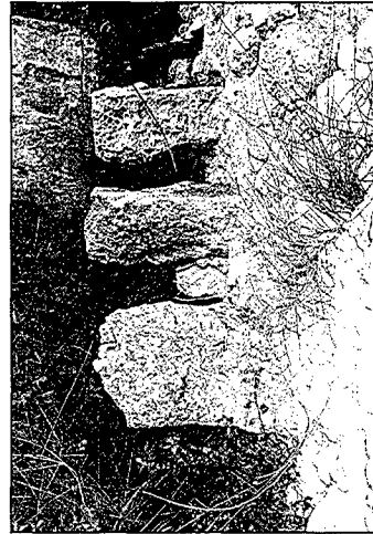
La pedra i l'enginyer de les persones feia miracles per sobreviure

Antics costums on es va perdre el motiu del seu origen cultural i pràctic dels nostres avantpassats. Cada vegada queden menys persones per poder-ne donar raó. En fotografies adjuntes tenim alguns d'aquests testimoniatges en pedra existents encara al nostre entorn, com oliverars i hortes, encara que sense el seu ús originari.