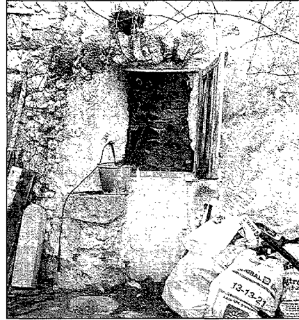
La galleda metàl·lica era molt usada per treure aigua del pou, amb rest i corriola.

Per conservar la memòria històrica i el record d'alguns pous, són aquestes fotografies de la col·laboradora, Angelina, que amb molta sensibilitat ha recollit aquestes imatges. Aquests pous són testimoniatge de tants altres que nodrien d'aigua a pagès i que alguns, amb les seves pedres, han deixat d'existir.