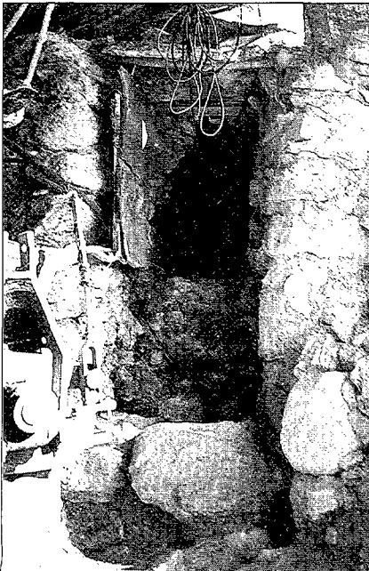
Pous diversos amb molts anys d'història.