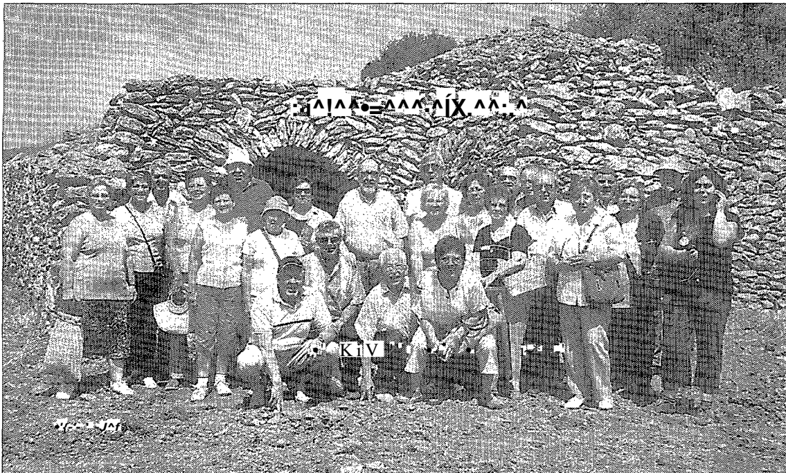
Una imatge dels participants de la trobada feta ai Pla