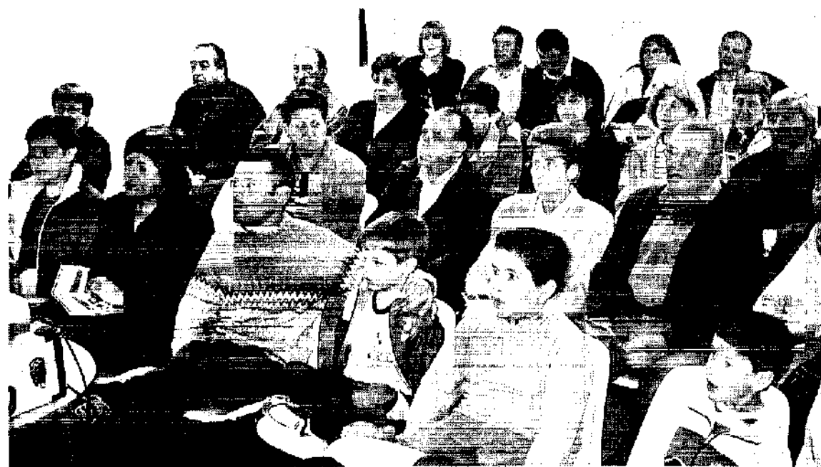
Públic assistent a la xerrada