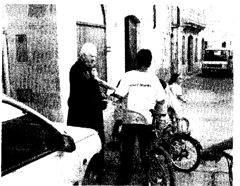
Diferents imatges de la benedicció