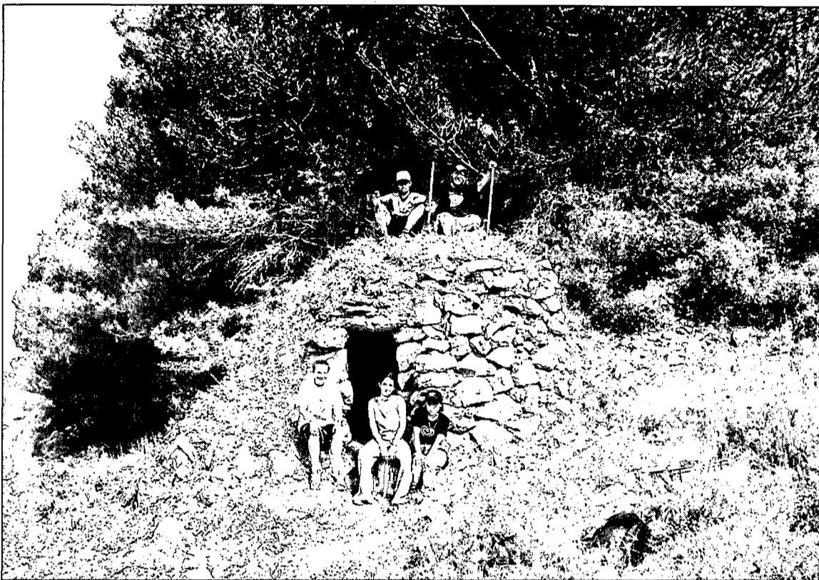
Cabanes de pedra seca. Alguns dels participants al camp de treball Transhumants 99 al costat d'una de les cabanes

L'any passat el treball es va centrar a la muntanya Gran del Masís, amb la descoberta de moltes