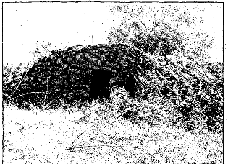
El bosc de Tosca presenta una important diversitat de tipologies de pedra.

S'hi van analitzar amb atenció les àrees de Batet, la Serra i el bosc de Tosca, on existeix una diversitat de tipologies de pedra seca força remarcable. Pel que fa a les característiques ecològiques dels murs i marges de paret seca, es presentà un primer inventari biològic, botànic i faunístic que mostrava com una gran part de l'elevat nombre d'espècies que hi viuen depenen directament d'aquest hàbitat, construït per l'home per a la seva