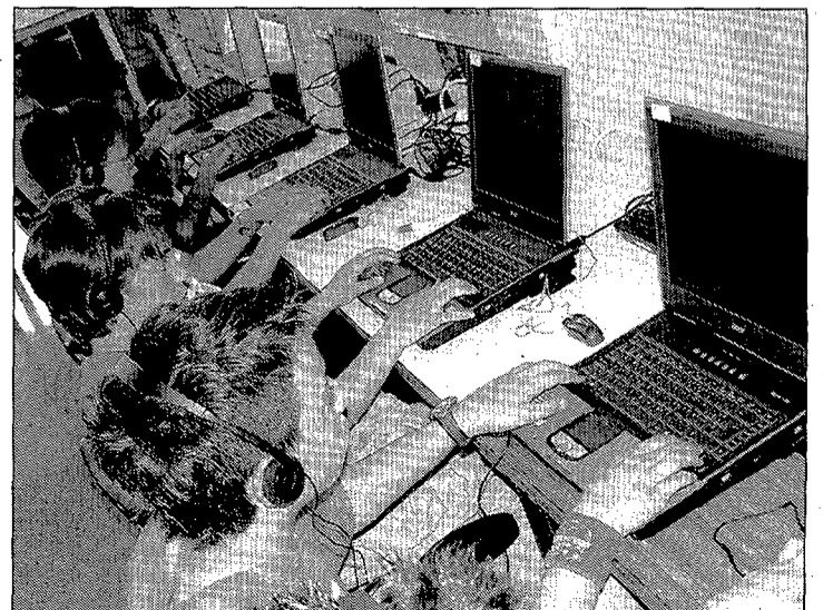
Jugant en xarxa al Centre Cívic de Bellvei

Els joves de Bellvei, durant aquest trimestre, tenen la possibilitat de practicar futbol sala els dimarts i dijous, fer aerodance i hip-hop, els dimecres d'abril i maig, o practicar jocs en xarxa. El passat dimecres, al Centre Cívic, es va fer una sessió de jocs en xarxa que va tenir força èxit entre els joves.